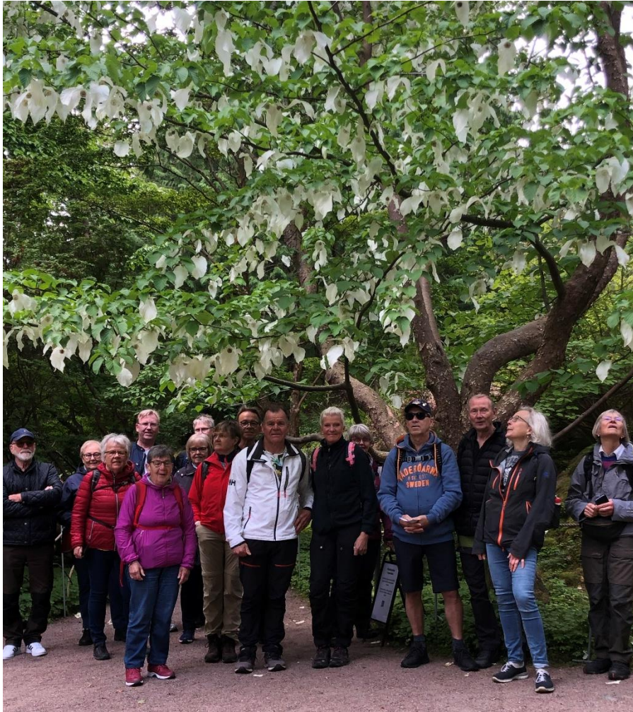
Botaniska i Göteborg där vi hade tur att se näsduksträdet blomma