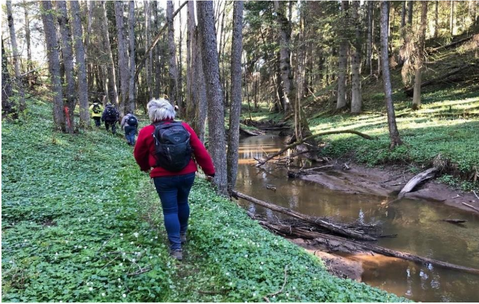
Händene, Åkedal med backsipporna