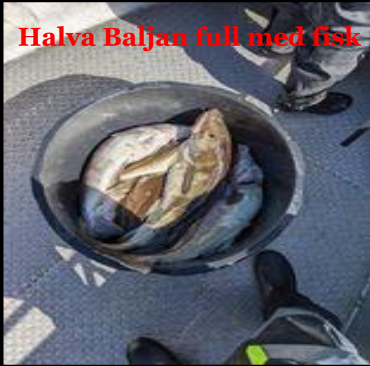
Halva Baljan full med fisk