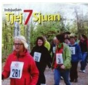
Tjej 7 sjuan 6/5 2014 i Lundsbrunn